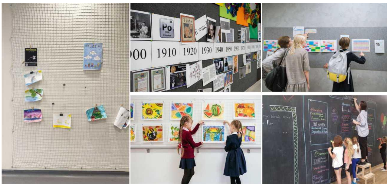
Ақидаҳои ҷолиб барои ороиши минтақаҳои муоширатӣ

Барои ҷойгир кардани маълумот, корҳои хонандагон, маводи методӣ ва эълонҳо метавон аз сатҳҳои гуногун истифода бурд: магнитӣ, грифелӣ, маркерӣ, пробкагӣ ва матой.