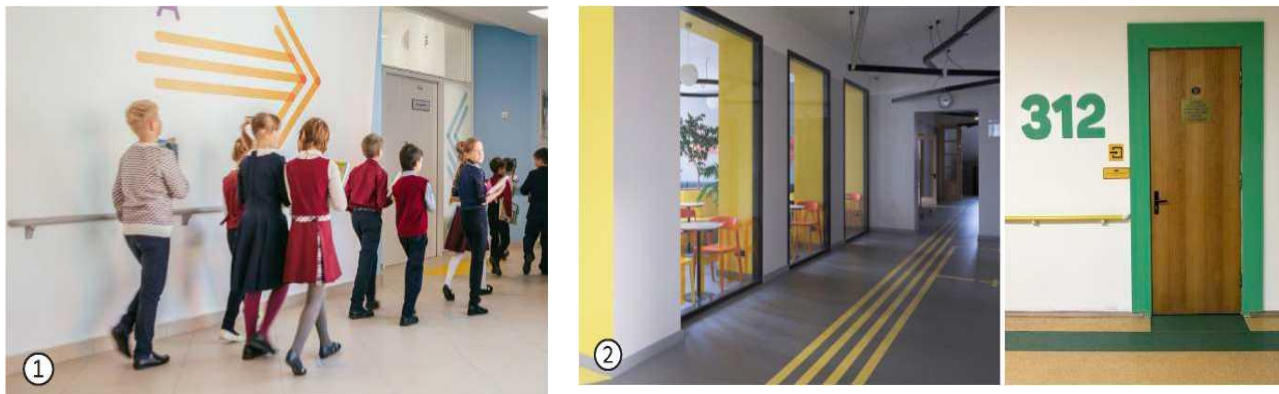
Ороиши фарогир. Аҳамияти онро нависед

Минтақаҳои истироҳатро бо мебелҳои гуногун оро диҳед, то имкони интиҳоб фароҳам гардад: диванҳо, мизҳо, курсиҳо, пуфикҳо, гурӯҳҳои мебел барои ширкатҳои гуногун.