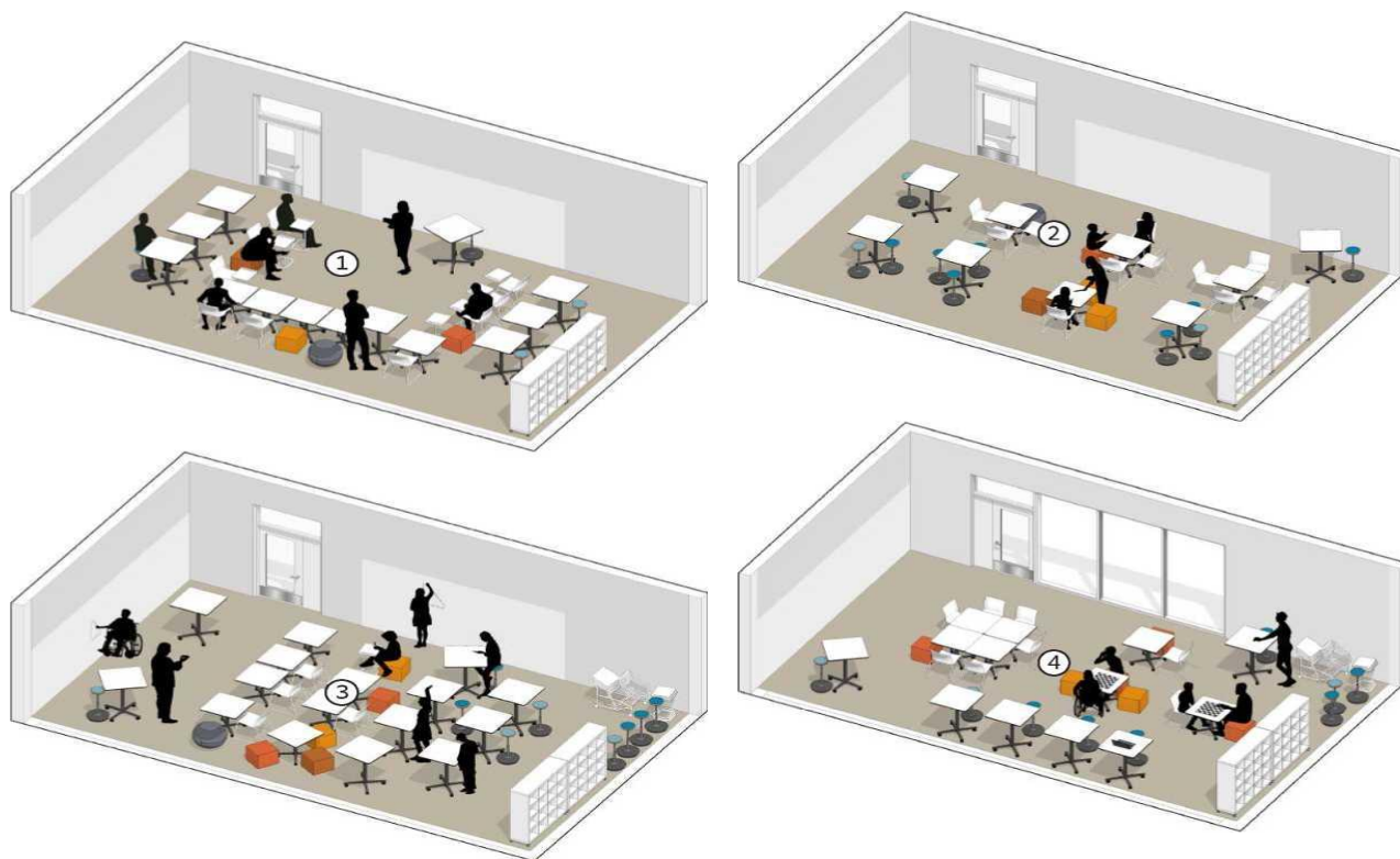
Кабинети фанҳои дақиқ

Дар ин мазмун — синфи универсалӣ ин утоқи таълимии бисёрмақсадро дар бар мегирад, ки бо мебелҳои гуногун ва ҳаракаткунанда мучахҳаз шудааст. Ин имконият медиҳад, ки хонандагон ҷойи таълимии фардӣ худро интихоб кунанд ва омӯзгор муҳити синфхонаро ба осонӣ мутобик ба вазифаҳои таълимӣ тағйир диҳад.